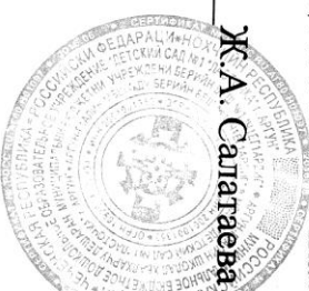
График заседаний Комиссии по противодействию коррупции МБДОУ «Детский сад №1 «Ласточка» г. Аргунь» на 2017-2018 учебный год.